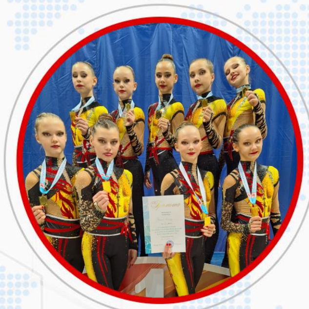
КОМАНДА ПО ЭСТЕТИЧЕСКОЙ ГИМНАСТИКЕ «РОКСЭТ-АЛМАЗ»