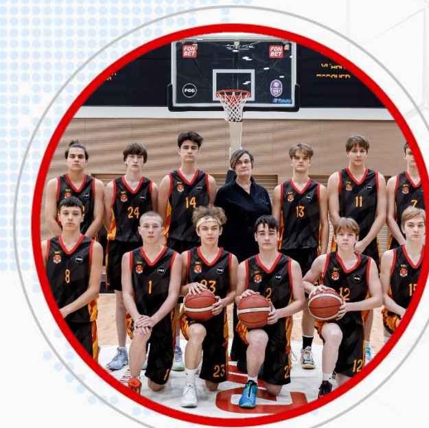
КОМАНДА ЮНИОРОВ 2008 Г.Р. ПО БАСКЕТБОЛУ