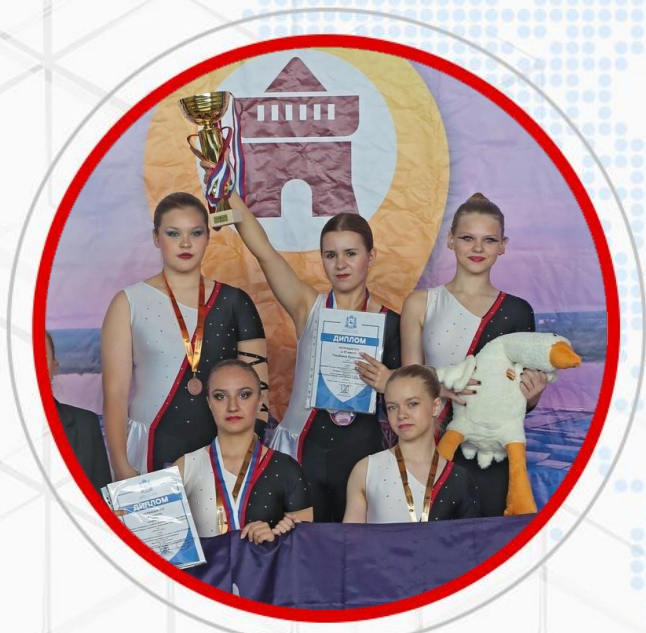
КОМАНДА ПО ЧИРСПОРТУ «GRAND PRIX»