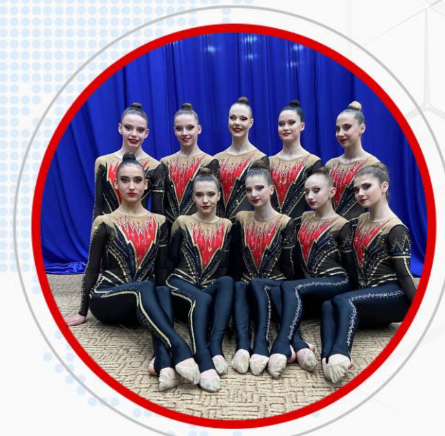
КОМАНДА ПО ЭСТЕТИЧЕСКОЙ ГИМНАСТИКЕ «РОКСЭТ»