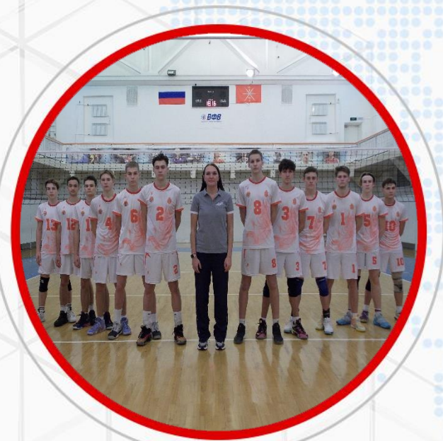
КОМАНДА ЮНОШЕЙ 2010-2011 Г.Р. ПО ВОЛЕЙБОЛУ

2024 РЕГИОНАЛЬНЫЙ КОНКУРС СПОРТСМЕН ГОДА